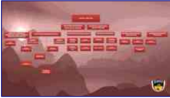
Organigrama de la Alcaldía municipal de Fresno, Tolima