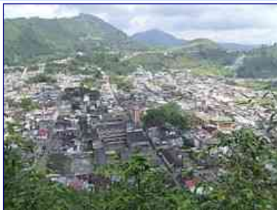
Panoramica de Fresno.