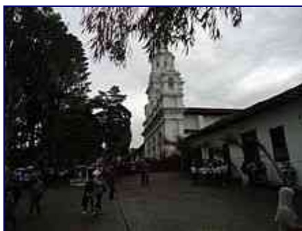
Parque principal de Salamina.