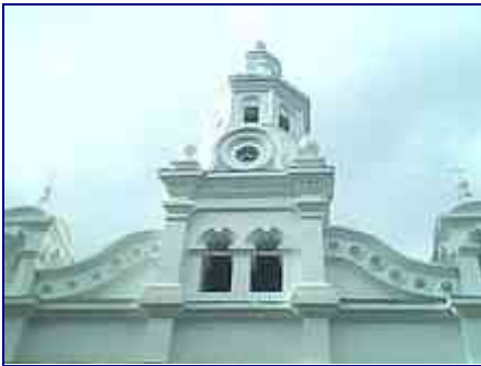
Templo parroquial de la Inmaculada.