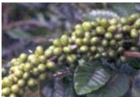
Figura 1. Frutos de café de consistencia semilechosa.

Los valores se expresaron en porcentaje del período estudiado (seis meses) y se consideraron de interés las floraciones por encima del 15%, las cuales brindan un buen pase de cosecha. Se contaron los frutos cada 15 días, en el estado de llenado y endurecimiento de la almendra, que se caracterizan por su color verde oscuro y consistencia semilechosa, denominados fruto 3 por Salazar et al. (8) (Figura 1). La distribución de la cosecha se obtuvo a partir del total de estos frutos contados durante cada semestre y se calcularon los porcentajes para cada fecha (Figura 3).