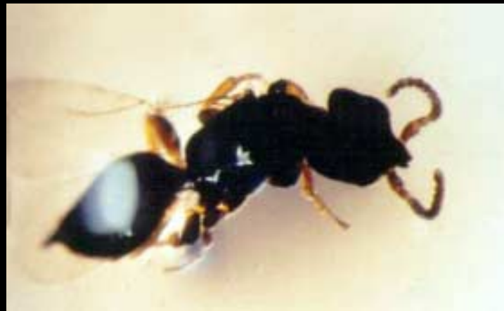
Prorops Nasuta (adulto)