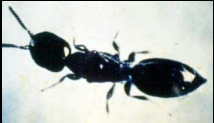
Cephalonomia stephanoderis (adulto)

A continuación se describen las principales características de las tres especies: