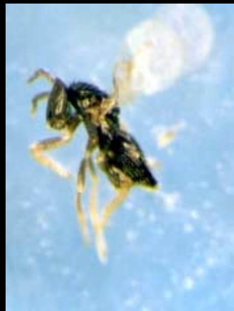
Phymastichus coffea (adulto)