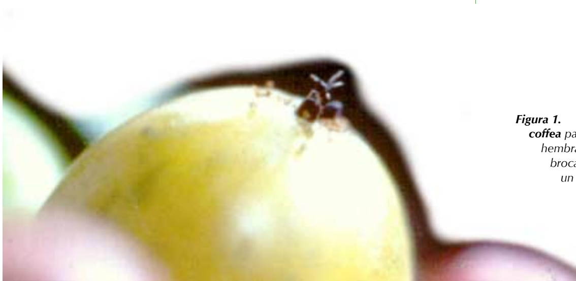
Figura 1. Phymastichus coffea parasitando una hembra adulta de la broca que penetra a un fruto de café.

CENICAFÉ se encuentra actualmente realizando trabajos de investigación sobre la cría y biología de este parasitoide en Chinchiná donde se introdujo una pequeña colonia para los primeros estudios y en el Instituto Internacional de Control Biológico (IIBC) en Inglaterra, donde después de realizada la cuarentena se estarán introduciendo más ejemplares. En el futuro cercano, se espera contar con este nuevo parasitoide para establecerlo en la zona cafetera.