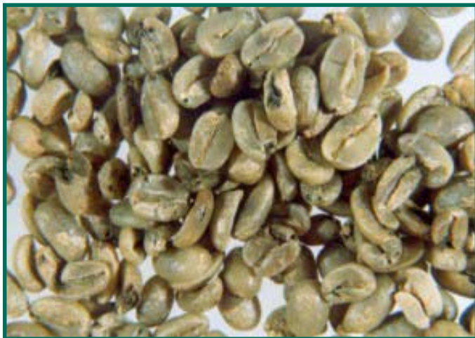
Figura 1. Grano atacado por la broca rechazado en la compra de café.

Las condiciones ambientales, especialmente la temperatura y la humedad, influyen en el desarrollo y comportamiento de la broca. El ciclo de vida de la broca es más corto en altas temperaturas y la emergencia de adultos del fruto está condicionada a la humedad; por