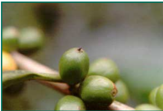
Figura 2. Estado de desarrollo de los frutos el cual es susceptible de ser atacado por la broca del café.

ello, después de períodos de lluvia se puede esperar la emergencia de brocas que van a colonizar nuevos frutos (2).