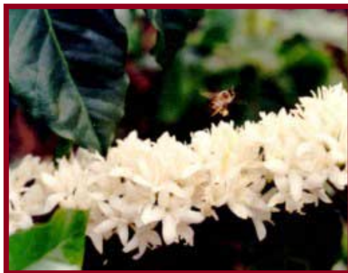
La floración determina el desarrollo de la cosecha y el ataque de la broca del café

aptos para el desarrollo de su progenie. Estos frutos son aquellos de naturaleza semiconsistente con un