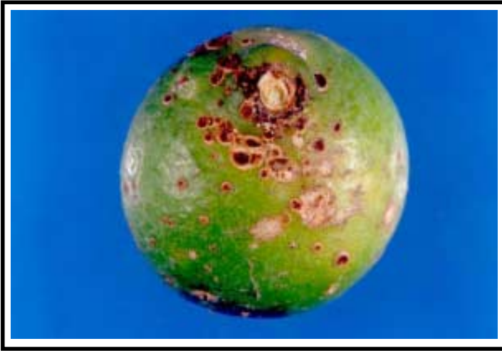
Figura 6. Fruto maduro de tangelo Mineola con ataque avanzado de Alternaria sp. Nótese las lesiones superficiales, tipo "cabeza de clavo" que causan demérito de la calidad.