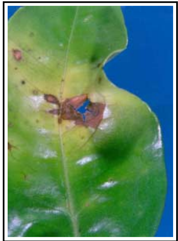
Figura 2. Lesión en estado avanzado ocasionada por Alternaria sp. Obsérvense el avance de la infección a través de las nervaduras.