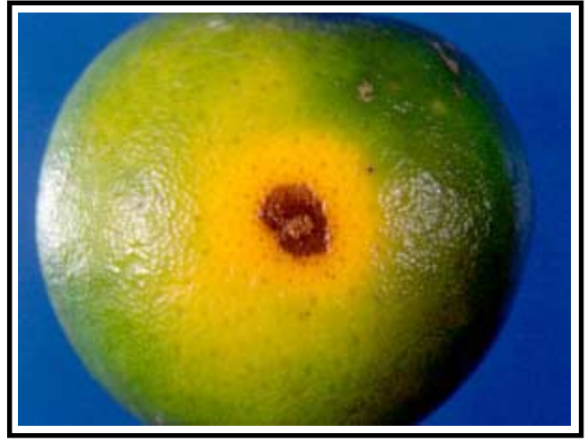
Figura 7. Fruto maduro de tangelo Mineola con ataque de Alternaria sp. Nótese este tipo de lesión levemente hundida, la cual puede profundizar al endocarpio.