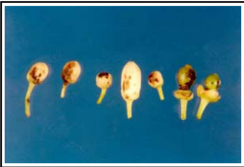
Figura 9. Botones florales y frutos recién formados con lesiones ocasionadas por Alternaria sp. en inoculación artificial.

Los aislamientos de Alternaria sp. obtenidos en este trabajo, muestran características similares a las registradas en la literatura consultada (1, 3, 10, 13, 15, 18, 19), tales como: esporulación abundante, micelio septado, conidióforos que emergen directamente del sustrato, cadenas conidiales largas, conidias inicialmente redondeadas y binucleadas u ovaladas, y posteriormente ovoides, de color café amarillento y multiseptadas transversal y longitudinalmente (Figura 10).