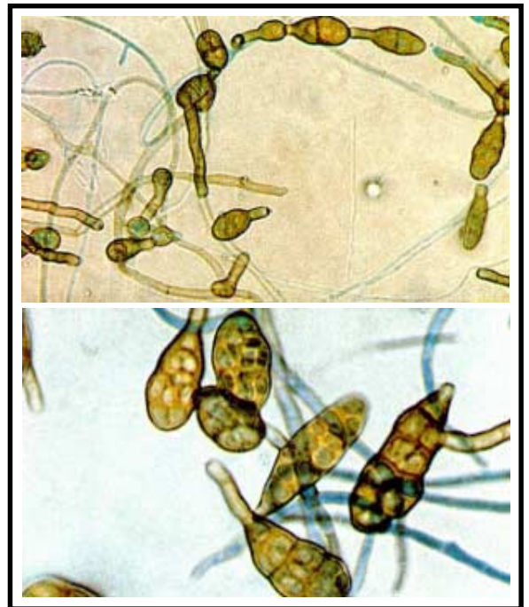
Figura 10. Conidias del hongo Alternaria sp. aisladas de lesiones foliares en tangelo, mandarina y limón. Nótese la forma ovalada y su disposición en cadena. (foto microscopio 40X y 100X).