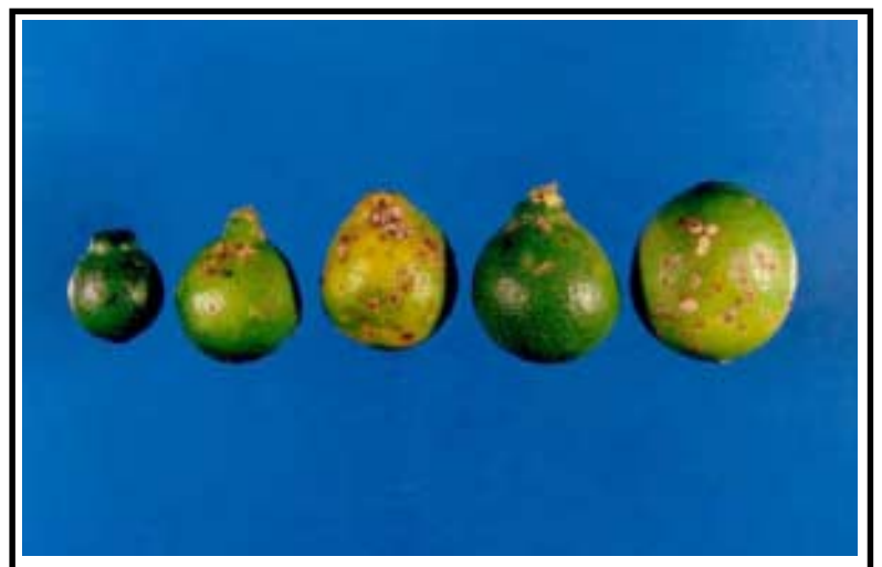
Figura 5. Lesiones de Alternaria sp. en frutos de tangelo Mineola de diferente edad. De izquierda a derecha frutos en diferentes estados de desarrollo.