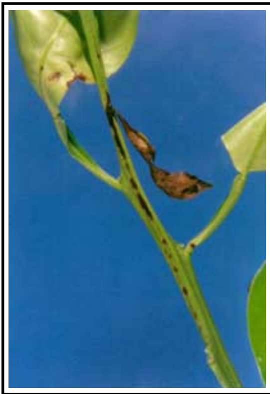
Figura 3. Lesiones de Alternaria sp. en tallos tiernos de tangelo. Nótese la lesión en la hoja como consecuencia del ataque en la rama.

Los botones florales también pueden ser afectados, así como las flores abiertas. En frutos, las lesiones pueden ocurrir desde el cuajamiento, en cuyo caso se observan puntos de color café oscuro rodeados de un halo amarillento que ocasionan su caída (Figura 4). A medida que los frutos se desarrollan se vuelven más resistentes a la enfermedad y disminuye su caída, aunque las lesiones continúan su desarrollo; éstas, son redondeadas de borde color café y están presentes en número variable (Figura 5). En estados más avanzados ocurre la formación de un tejido endurecido que posteriormente se encoge dando la apariencia de la cabeza de un "clavo" superficial, que se desprende fácilmente al frotarlo, dejando una pequeña concavidad (Figura 6). No obstante, también ocurren lesiones de este tipo que profundizan un poco hacia el endocarpio, pero sin llegar a afectar la pulpa (Figura 7).