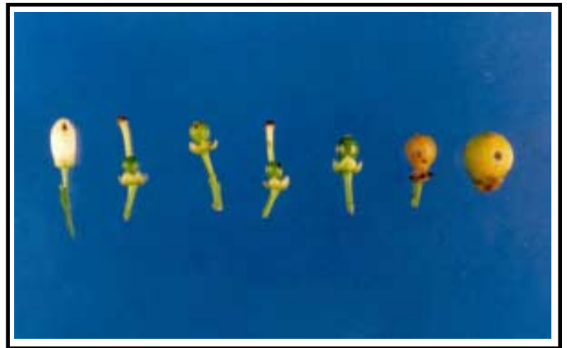
Figura 4. Lesiones ocasionadas por Alternaria sp. en botones florales y frutos jóvenes de tangelo Mineola. De izquierda a derecha flores y frutos en diferentes estados de desarrollo.