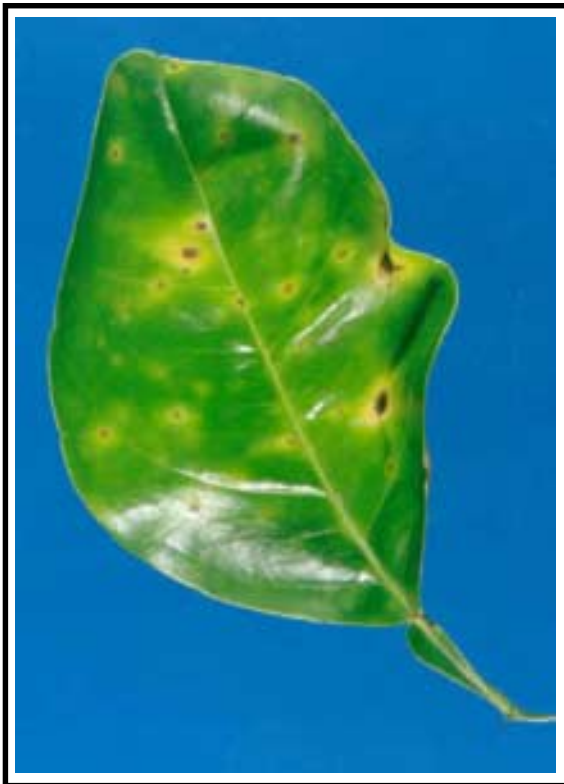
Figura 1. Lesiones iniciales de ataque de Alternaria sp. en hojas de tangelo. Obsérvense los puntos color café rodeados de un halo clorótico.

En las hojas, los síntomas se inician como puntos de color café oscuros rodeados de un halo clorótico (Figura 1). Posteriormente la lesión crece en forma irregular, y puede extenderse a lo largo de las nervaduras. En estados avanzados y cuando no ocurre defoliación, se observa el rompimiento de los tejidos necrosados en el centro de la lesión (Figura 2).