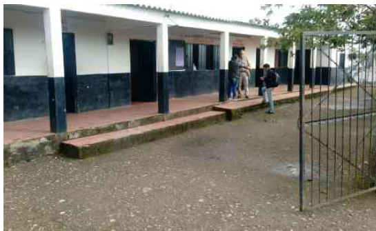
Sede Las Marías

Dos de las sedes rurales del Real Campestre: Mireya y Las Marías, cubren primaria básica y secundaria, en las otras sedes solo se tiene acceso a primaria básica en la modalidad de Escuela Nueva. En esta modalidad un docente atiende estudiantes de los grados 1 a 5.