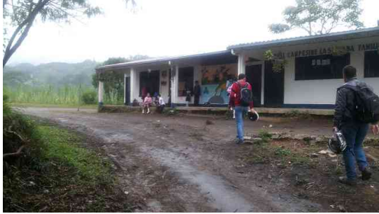
Sede El Arrayán