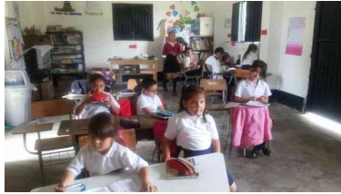
Aula única Remolino