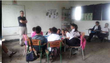
Aula única El Arrayán