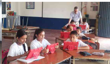
Aula única La Ceiba